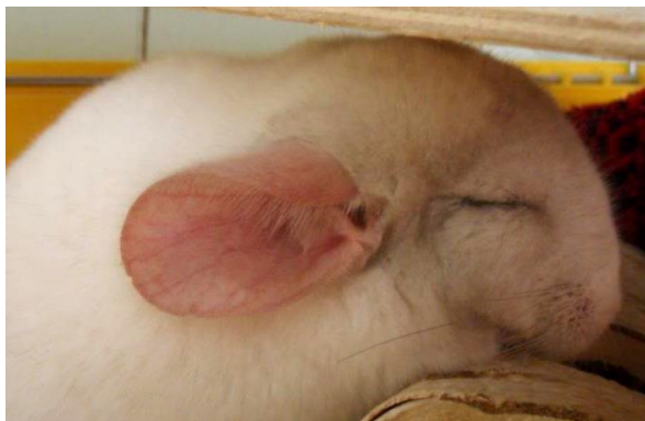
Fot. K. Wojciechowska – zaczerwienione uszy

Przegrzane pomieszczenie, zbyt silne nasłonecznienie, niemożność odprowadzenia ciepła z organizmu, zwiększony wysiłek fizyczny, zamknięcie w kiepsko wentylowanym transporterze mogą wywołać udar cieplny. Przyjmuje się, że temperatura otoczenia około 26°C to maksimum tolerowane przez szynszyle, jednak już wtedy konieczne jest wyczulenie na sygnały wysyłane przez zwierzę i reagowanie na nie.